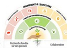
Tableau de bord de la Stratégie nationale pour la littératie financière